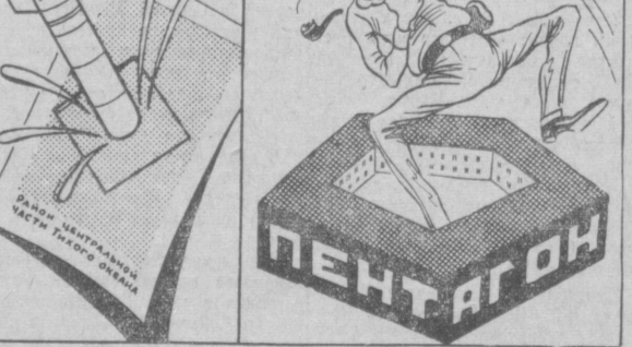
АУНУЛОСЬ В КВАДРАТЕ — ОТКЛИНУЛОСЬ В ПАТИГОЛЬНИКЕ... (Пентагон — от греческого «пятиугольник» — здание в виде пятиугольника, в котором помещаются руководящие военные учреждения США).

(Из речи товарища Н. С. ХРУЩЕВА на Всероссийском съезде учителей 9 июля 1960 года).