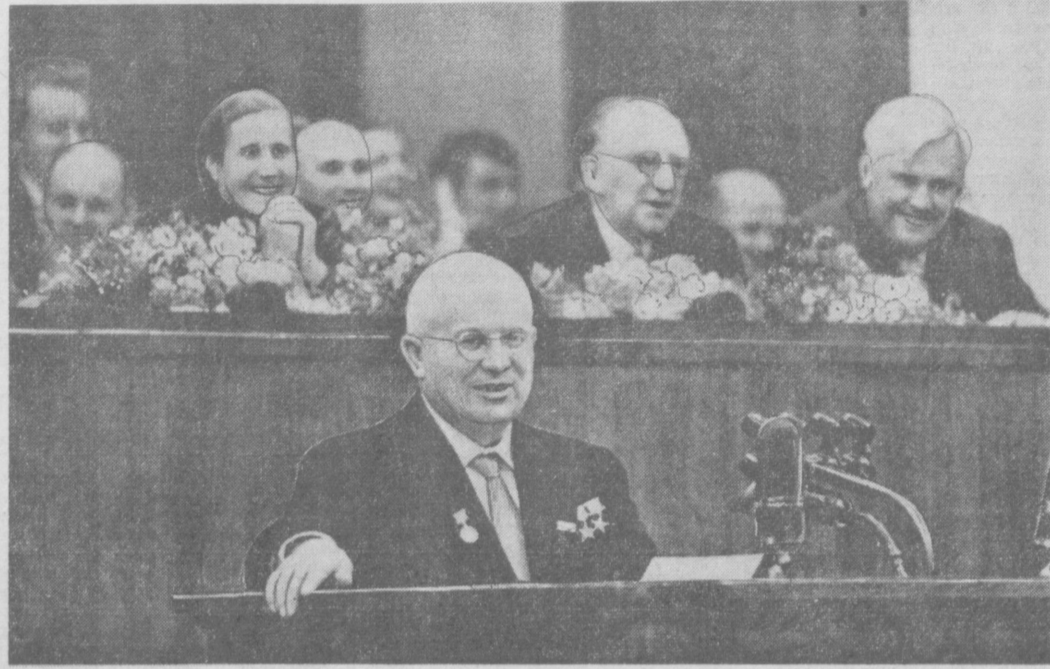
Председатель Совета Министров СССР Н. С. ХРУЩЕВ на трибуне Всероссийского съезда учителей.