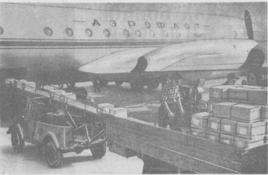
19 июля из Шереметьевского аэропорта столицы нашей Родины вылетели три самолета с пищевыми продуктами для Республики Конго, народы которой героически отстаивают свою свободу и независимость.