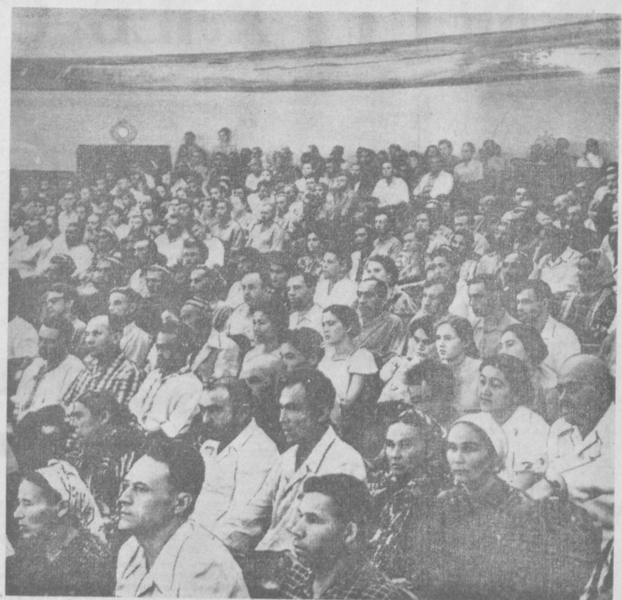
В зале республиканского совещания передовиков соревнующихся за звание бригад и ударников коммунистического труда.