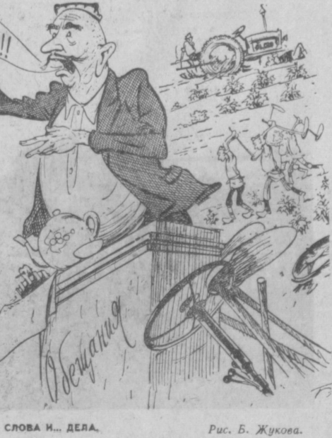
Слова и дела. Рис. Б. Жукова.