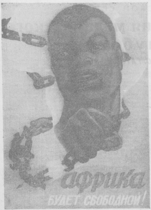
Плакат художника В. КОРЕЦКОГО. (ИЗОГИЗ, Москва).