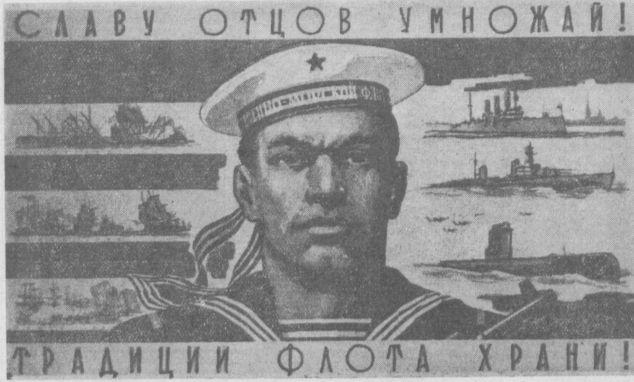
СЛАВУ ОТЦОВ УМНОЖАЙ! ТРАДИЦИИ ФЛОТА ХРАНИ!

В своих нотах Советское правительство расценивает решение бундестага о создании в Западном Берлине наблюдательного совета для осуществления контроля за радиопередачами на Германию и Европу, как открытое призывание ФРГ на Западный Берлин. Советское правительство считает своим долгом заявить в нотах, что оно не признавало и не признает каких-либо законов и постановлений властей ФРГ в отношении Западного Берлина. (ТАСС).