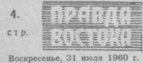
Воскресенье, 31 июля 1960 г.

Останавливаясь на вопросах трудового воспитания учащихся молодежи, оратор подчеркивает значение повседневной связи производственных и школьных коллективов. Центральным Комитетом ЛКСМ Узбекистана недавно одобрил опыт работы комсомольских организаций промышленных предприятий и школ Беговата.