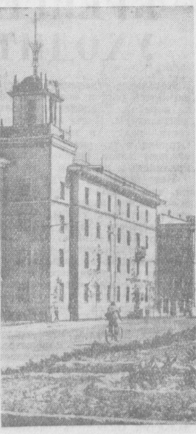
Ташкент сегодня. Уголок Ново-Московской улицы.