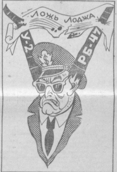
А ослиные уши Пентагона все равно торчат... Рис. Г. КОЛЧИНСКОГО.