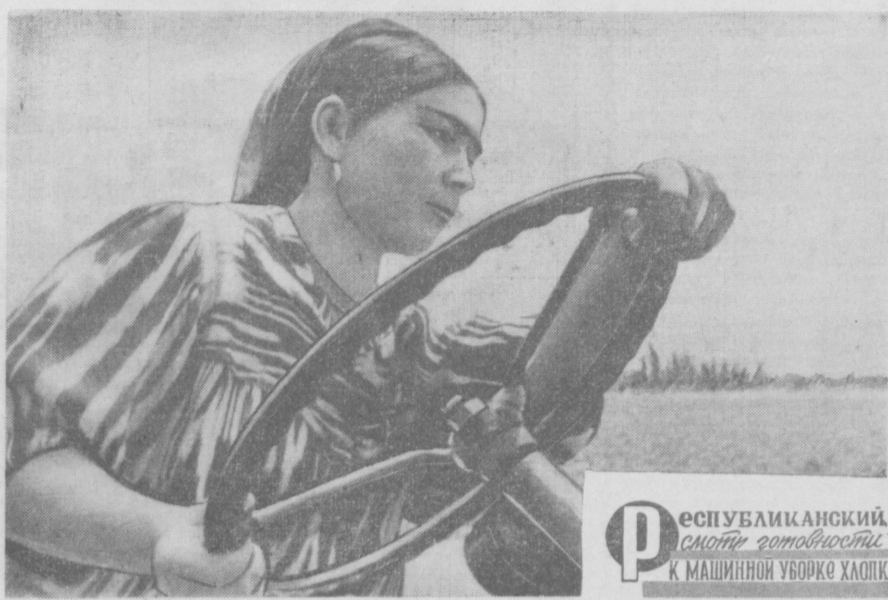
РЕСПУБЛИКАНСКИЙ слоты готовности К МАШИННОЙ УБОРКЕ ХЛОПКА