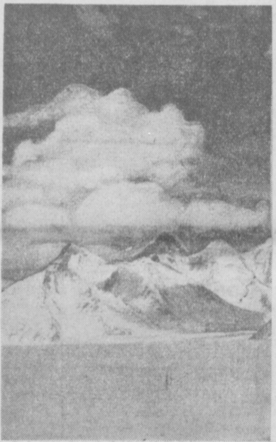
под вечным снегом...

— Змей во дворе держат! Ах, идоли! — необыкновенно орала она по утрам, держась на почтительном расстоянии от дворовой «новорожденной». Виталька узнал: он как раз и будет первым после этого человека, кто пойдут на штурм недоступной вершины. Он — и его друзья.