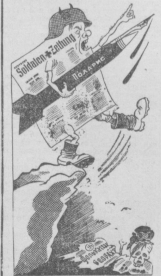
Те, кто «никогда не откажутся», — в пропасти черной окажутся. Рис. Г. Колчинского.

Недавно западногерманская газета «Зольдатен цейтунг» поместила статью под заголовком «Мы никогда не откажемся».