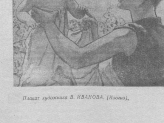
Плакат художника В. ИВАНОВА. (Изозд.)

Заботиться о здоровье ребенка мать должна начинать задолго до его появления. Для этого государство предоставляет беременным женщинам родовой отпуск на 56 календарных дней и такой же — после родов. Но до декретного отпуска беременная женщина должна посещать консультацию, в которой даются советы по гигиене, режиму питания и т. д. Там же она может пройти профилактическую подготовку к родам, получить правильное представление об этом процессе.