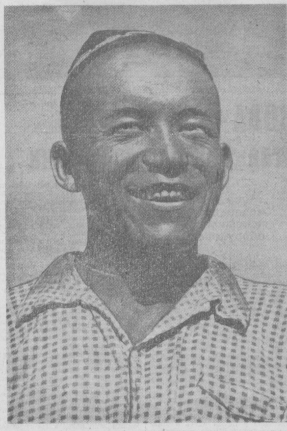
СЕГОДНЯ НА ПРОВЕРКЕ КАРА-КАЛПАКСКАЯ АССР