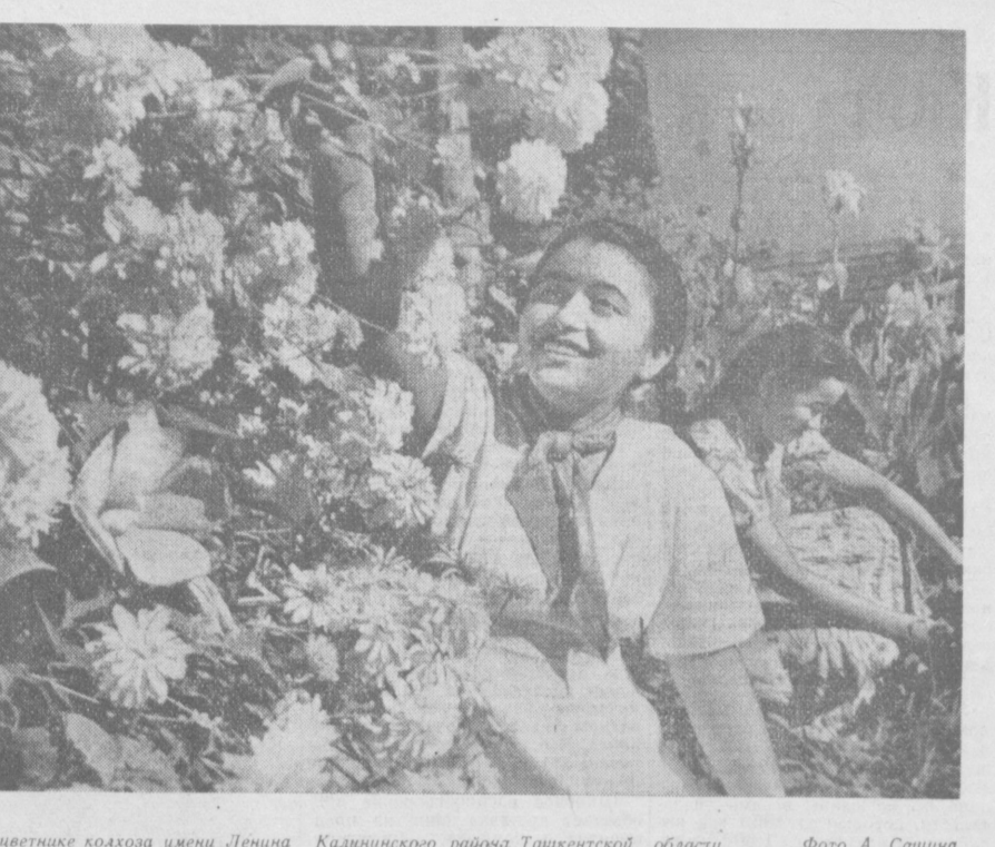
В цветнике колхоза имени Ленина Калининского района Ташкентской области.

И тут мы стали свидетелями того, как необходимо транспорное кольцо. Уже сейчас, вопреки запретам, на дороге прорываются автомобили с грузами и мчатся в город кратчайшим путем. Не так легко остановить их, «раскусивших» выгоды новой магистрали! Мы убедились, что автодорожники могут строить во много раз быстрее. Есть возможность упрямиться с делом до больших долей. Но есть помехи. Отгораживает прежде всего то, что облизником, а также некоторые другие организации не горятяся с отчуждением земель, со сносом строений, стоящих на пути трассы.