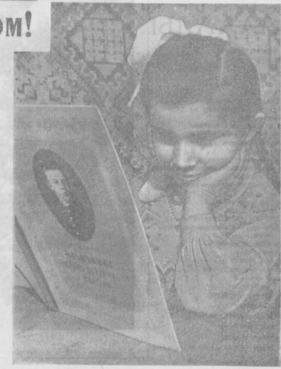
Минуткой каждой дорожить Научат эти строки, ...Вот дождится про него — И саду за уроки!

*) Маршал Советского Союза В. И. Чуйков. «Начало пути». Военное издательство Министерства обороны Союза ССР, Москва, 1959 г.