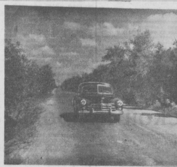
Там, где были барканы, пролегла хорошая дорога.

А. ГРЕЧУШКИН, Начальник конструкторско-технологического бюро.