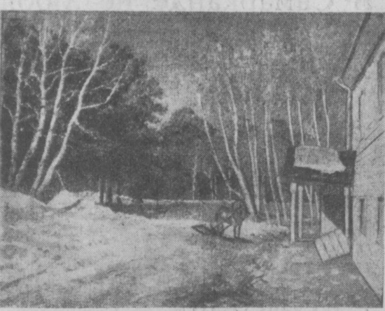
И. И. Левитан, «Март».