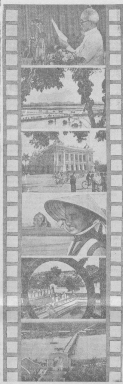
Около полудня провели во Вьетнаме кинооператоры Узбекистана М. Каюмов, А. Турсунов и М. Пенсон. Они работали там над съемками документального фильма: «Вьетнам, страна моя». Печатающие кадры из этого фильма: 1. Президент Хо Ши Мин выступает на митинге трудящихся. 2. Поля сельскохозяйственного кооператива в районе Нинь Бинь. 3. Ханой, государственного театра. 4. Сельская учительница Нгуен Лан. 5. Ханой, храм литературы. 6. Река Бен Хай, разделяющая Северный и Южный Вьетнам.