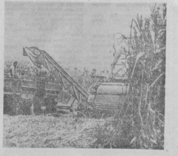
Получить по 800 центнеров силосной массы с каждого из 90 гектаров — такова обязательство кукурузоводов сельхозартеля имени XX партсъезда Калининского района. Обязательство выполняется НА СНИМКЕ: уборка и силосование кукурузы.