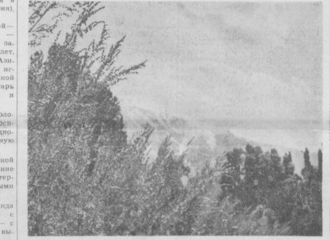
ГОРНЫЙ ПЕЙЗАЖ.

Как сообщает корреспондент агентства Франс Пресс из Элизабетвилля, 250 «добровольцев» из «армии освобождения» так называемого президента «гнорнуродного государства» Масаи Калонжи, изгнанного из этой нонгольской провинции войсками центрального правительства Респуб-