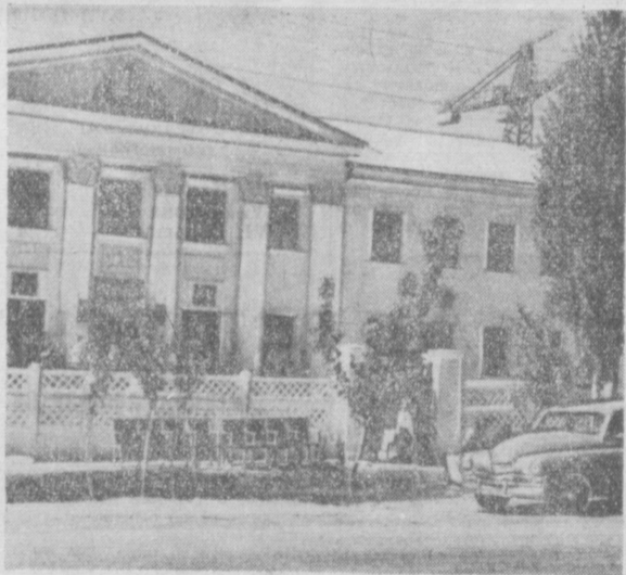
Первого сентября в г. Ленинске Андижанской области острепшимися раскрылись двери новой школы-интерната. Ее светлые, просторные классы заполнили более ста мальчиков и девочек. К услугам воспитанников — пионерская комната, комнаты для массовой работы, учебные мастерские, хорошо оборудованные спальни. На СНИМКЕ: Новое здание школы-интерната в г. Ленинске.

На письмо, посланное редакцией газет для принятия мер, за истекущую неделю получено 105 ответов от советских и партийных органов республики.