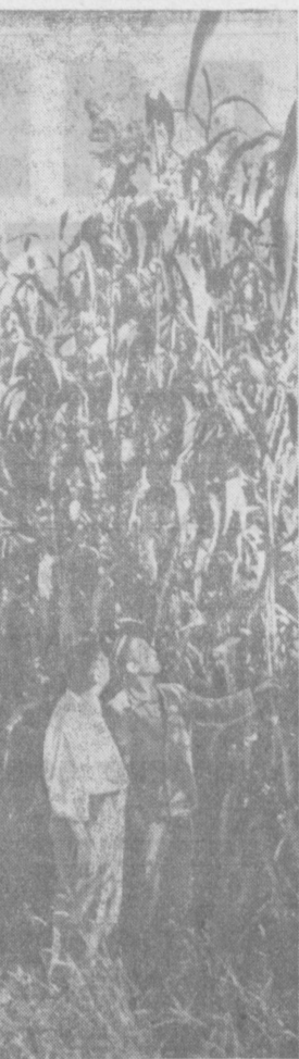
Вот как о Джамуру вырастили колхозники совхозартели имени Ленина Избаскентского района Андижанской области. Здесь с гектара навозника будет снято 1,200—1,300 килограммов зеленой массы. На каждой фазанской корову решено заготовить по 18—20 тонн отлачного сенажа.

Государственному комитету высшего и среднего специального образования