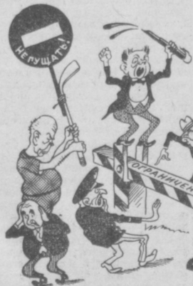
Рис. Г. КОЛЧИНСКОГО.

ПРАВДУ — НЕ ОГРАНИЧИТЬ, МИР — НЕ ОСТАНОВИТЬ!