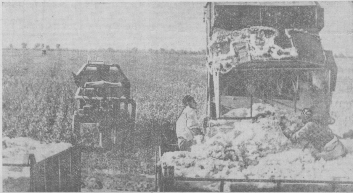
Коллектив совхоза «Малеж» Ташкентской области решил собрать в этом году восемьдесят процентов урожая хлопка машинами. Весь хлопок перевозится по новому методу — без тары.