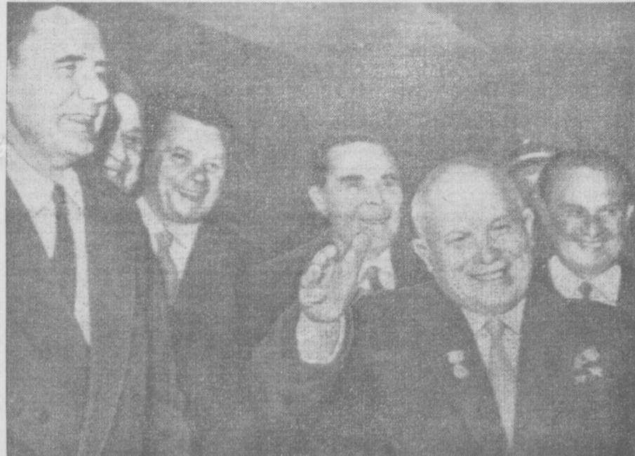
Открытие XV сессии Генеральной Ассамблеи ООН. Никита Сергеевич Хрущев и члены советской делегации входят в зал заседаний.