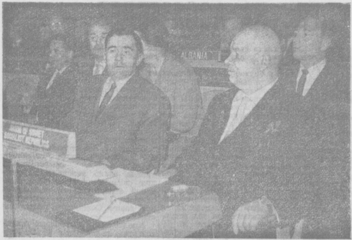
Н. С. Хрущев и А. А. Громыко в зале заседаний сессии.