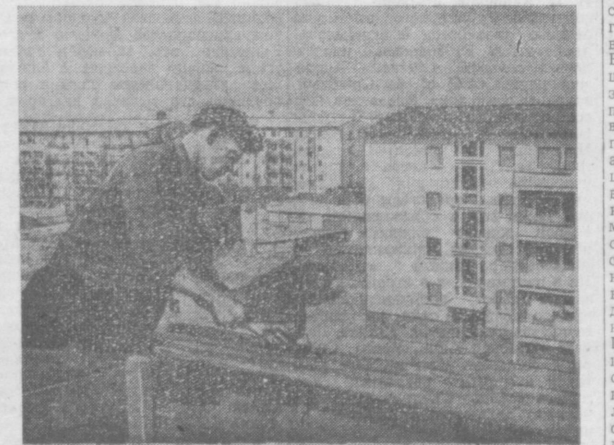
Германская Демократическая Республика, Хоёрсверда — город строитель большого промышленного комбината «Шварце нумле», сооружаемого в округе Коттбус. За лето, истекших с начала строительства, здесь выросло много жилых кварталов.

Но построение социализма — это не только сооружение новых предприятий и увеличение выпуска продукции в целях постоянного улучшения материального положения трудящихся; оно означает также воспитание нового человека — человека социалистического общества. О том, как проходит процесс социалистического воспитания людей, изменения их отношения к общественной жизни, свидетельствуют многие мероприятия партии и правительства в области идеологии и культуры. В 1959—1960 годах под руководством партийных организаций СЕПГ проводилось обсуждение основных вопросов международной и внутренней политики, разъяснялись многие идеологические и политические вопросы: взаимосвязь политики и экономики, мирное сосуществование государств с различным общественным строем, борьба за мир и мирное решение германского вопроса, выполнение главной экономической задачи ГДР и другие. В обсуждении этих вопросов участвовали широкие слои населения. Росту социалистического сознания трудящихся способствовали также многие крупные мероприятия в области культуры, искусства, спорта, науки, культуры, недели Вальтиского моря, фестивали художественной самодеятельности и другие.