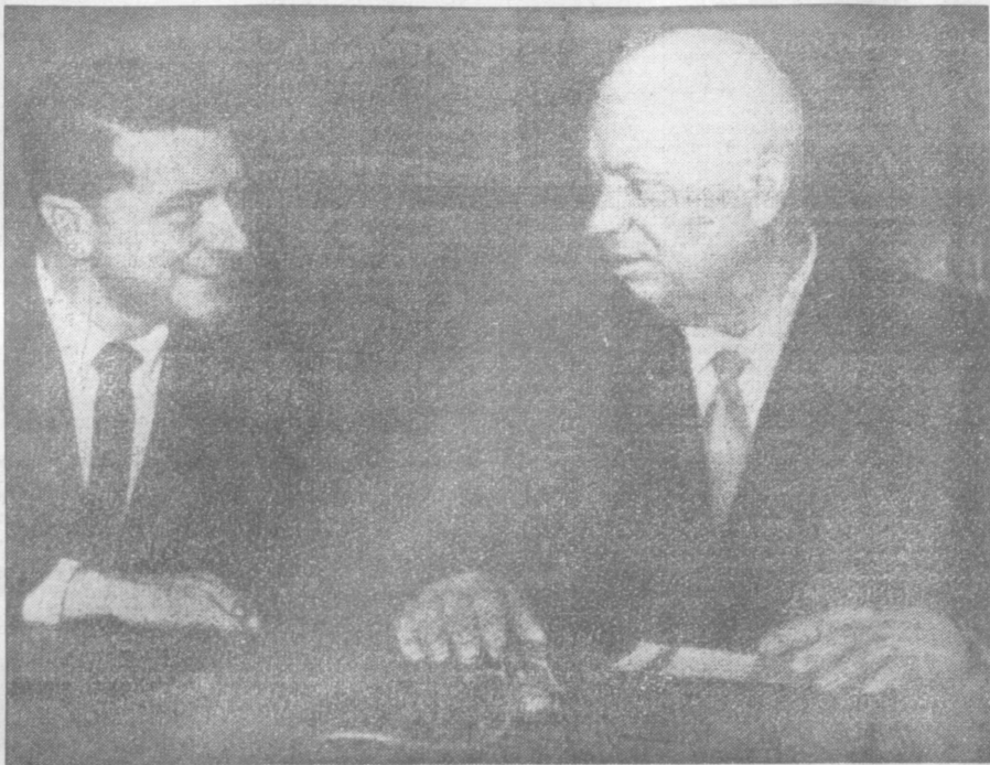
Н. С. Хрущев и американский радиокорреспондент Д. Саскайнд перед выступлением по американскому телевидению. Фото специального фотокорреспондента ТАСС В. Егорова. (Снимок принят по фототелеграфу).

Н. С. Хрущев. Вы ошибаетесь. Д. Саскайнд. Господин Хрущев! Выступая на Генеральной Ассамблее ООН, премьер-министр Великобритании Макмиллан сказал, я