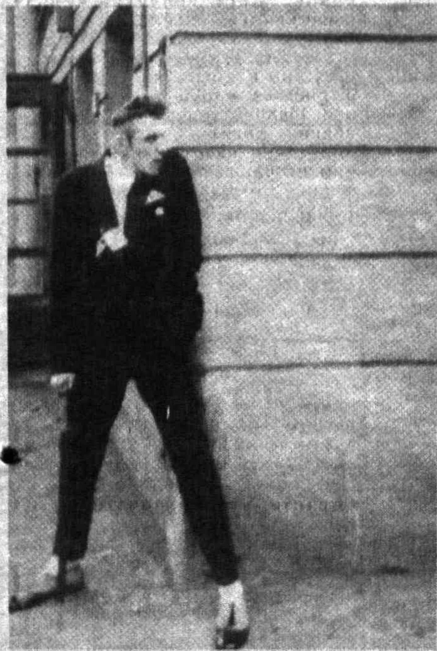
Последний «писк» моды