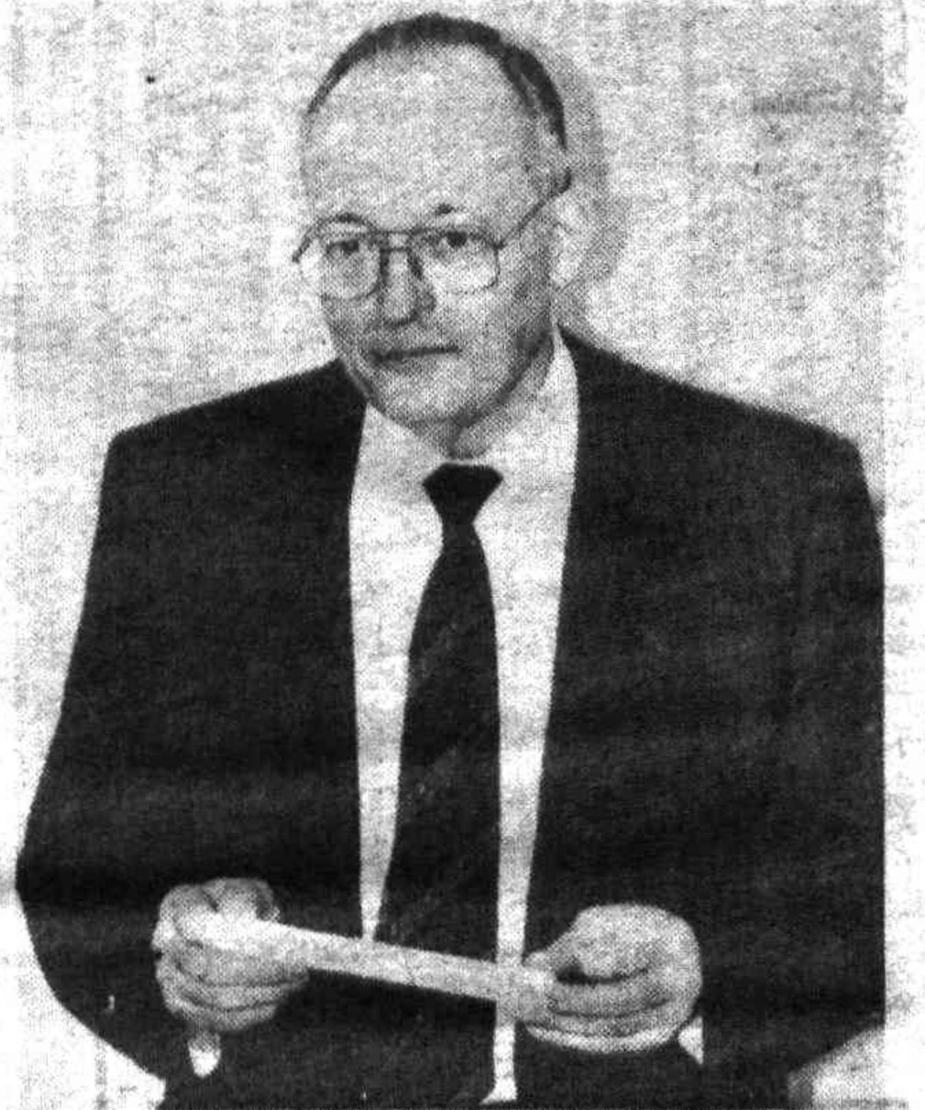
исходящее. Хотелось бы, чтобы в 1997 году Узбекистан продолжал свое продвижение по пути реформ.

На встрече с дипломатами и журналистами, состоявшейся 27 декабря 1996 года, Президент Ислам Каримов назвал прошедший год «Годом активного международного сотрудничества Узбекистана со многими международными организациями и странами мира». Особую роль в осуществлении этого сотрудничества играют посольства и представительства зарубежных стран, аккредитованные в Ташкенте.