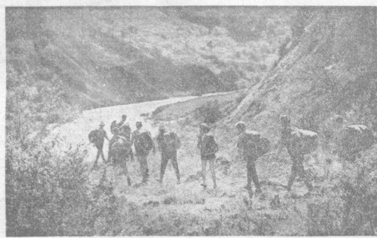
Пришло жаркое лето. Ожили туристские тропы, берега озер и рек. В походы по родному краю отправляются не только школьники, у которых сейчас летние каникулы, но и тысячи горожан. Ведь у них два выходных! На снимках слева — в туристском походе: трава — вода и дети и мамы!

16 ПОНЕДЕЛЬНИК ПЕРВАЯ ПРОГРАММА, 6.15 Концерт, 7.40 Оркестровая музыка, 7.55 «Полночь в долине», 8.25 Произведения композиторов И. Ниромова и А. Касымова, 9.15 «Рассказы о коммунистах» (уб.), 9.30 Симфонические танцы, 9.50 «Взгляд в будущее» (уб.), 10.30 Музыкальная викторина (уб.), 11.15 «Вечная жизнь», Страницы биографии В. И. Ленина (уб.), 11.30 Е. Бродский. Концерт для скрипки с оркестром, 12.30 Играет концертно-эстрадный оркестр Всесоюзного радио и телевидения, 15.15 Концерт симфонического оркестра Узбекфильма, 16.10 «Творчество композиторов Узбекистана» И. Хамраев, 16.50 Обзор «Правды» (уб.), 17.00 «Славим вождя», Стихи Э. Салимжана (уб.), 17.30 Концерт казахской музыки, 18.00 «За честь Ферганской марки», Выступление секретари Ферганского обкома партии В. Салдынова (рус.), 18.10 «Тебе, Ильич!» Концерт (рус.), 19.00 «Актуальные проблемы» (Молдова), 19.15 Последние известия (уб.), 19.23 Последние известия (рус.), 19.30 «Поэмы о труде