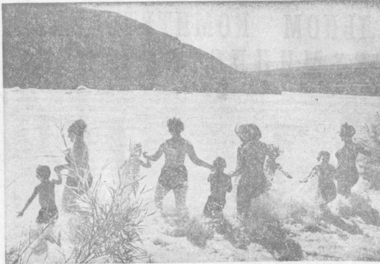
Пришло жаркое лето. Ожили туристские тропы, берега озер и рек. В походы по родному краю отправляются не только школьники, у которых сейчас летние каникулы, но и тысячи горожан. Ведь у них два выходных! На снимках слева — в туристском походе: трава — вода и дети и мамы!

СЕГОДНЯ днем по Каракалпакской АССР и Хорезмской области ожидается небольшая облачность, без осадков. По остальной территории республики — ясно. Ветер по Каракалпакской АССР Хорезмской и Бухарской областям западный, 5—10 метров в секунду. Интервенция «Полтава». Премьера телевизионного музыкального спектакля, 23.30 «Время» 00.15 Программа цветного телевидения, 01.30 ЦСН — «Динамо» (Биев), 2-Я тайм. В Ташкенте — ясно. Ветер восточный, 3—7 метров в секунду. Температура 38—40 градусов. А. СУЛТАНОВ.