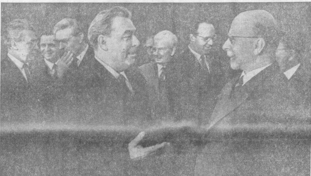
Международное совещание коммунистических и рабочих партий в Москве. На снимке: Генеральный секретарь ЦК КПСС Л. И. Брежнев беседует с Первым секретарем ЦК СЕПГ В. Ульбрихтом.

Выступивший на вечернем заседании 12 июня Председатель Национального совета Коммунистической партии Индии тов. Ш. А. Данге заявил, что КПИ полностью поддерживает обсуждаемые на Совещании документы. Мы надемся, сказал он, что эти документы будут единогласно приняты, даже если некоторые партии высказут оговорки по тому или иному пункту. Тов. Ш. А. Данге выдвинул предложение, чтобы международные совещания собирались периодически. Он предложил учредить на повестке Совещания орган, который мог бы взять на себя инициативу по созыву таких совещаний, когда это будет признано необходимым. Это могло бы помочь рассмотрению общих проблем и предосторожно расхождений, прежде чем они примут острую форму.