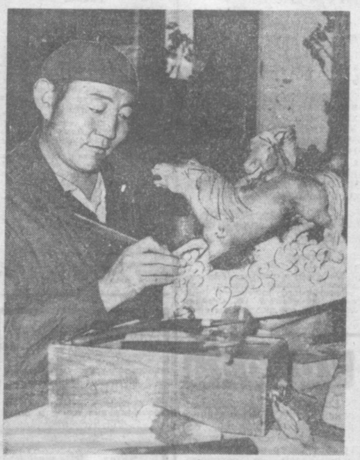
Резьба по дереву — один из популярных видов искусства в Монголии.

ИСТАРЫ монгольский народ проявлял свой талант в разнообразных формах художественного творчества, среди которых по богатству жанров первое место занимает литература.