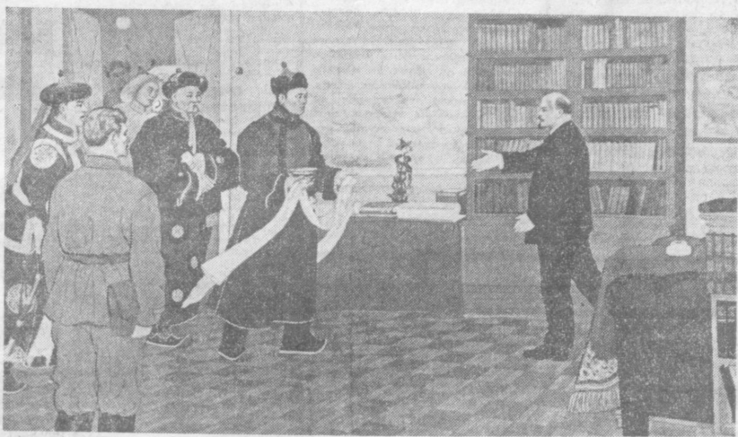
ТВОРЧЕСТВО МОНГОЛЬСКИХ ДРУЗЕЙ.