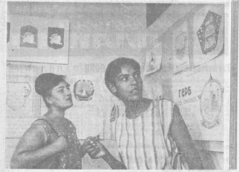
Около ста работ тридцати пяти самаркандских художников и их представителей на выставке эскизов герба, памятных медалей и значков посвященных юбилею Самаркандского областного Самаркандского отделения Союза художников Узбекистана. На снимках в одном из залов выставки.