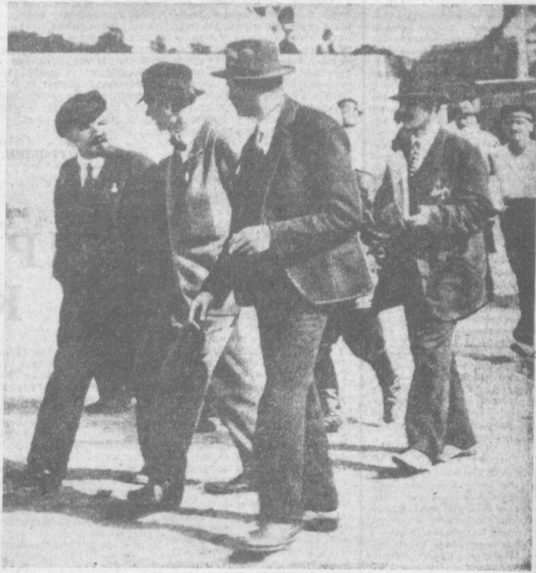
В. И. Ленин в группе делегатов II конгресса Коминтерна на площади Жертв Революции Петроград, 19 июля 1920 года.

Со мною рядом, в ложе для журналистов, сидел художник. Он пытался цепкими глазами фигуру Ленина, он силится перенести ее жизнь на бумагу. Но жест, но движения Ленина оставались непонятными. Художник пересел на другое место. Потом л его видел на третьем, на четвертом. Объективы фотоаппарата и кино вместе с ху-