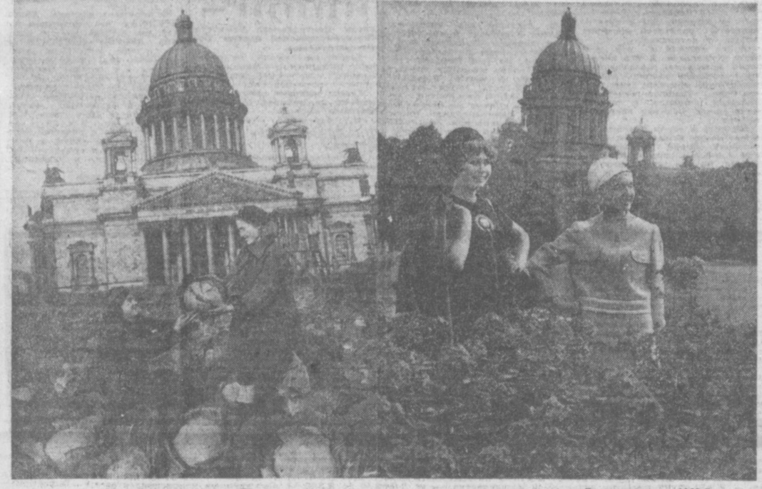
Ленинград во время блокады. Фото 1941-й.