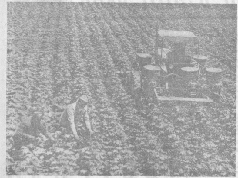
Богатый урожай зреет на полях колхоза имени Калинина, что в Ургенчском районе Хорезмской области. По 40 центнеров хлопка-сырца обмолотили в этом году члены этой артели. На снимке: идет обработка хлопчатника в бригаде М. Курбанова — одной из лучших в колхозе.