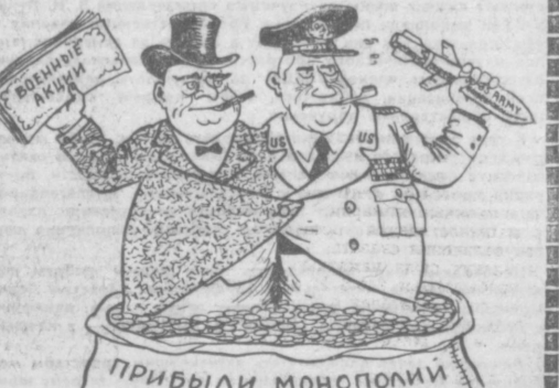
«Сматривайте близнецов». Рис. Ю. БРОДИЦКОГО.

Милитаристский внешнеполитический курс США отрицает проект взаимовыгодного союза крупного капитала с Пентагоном.