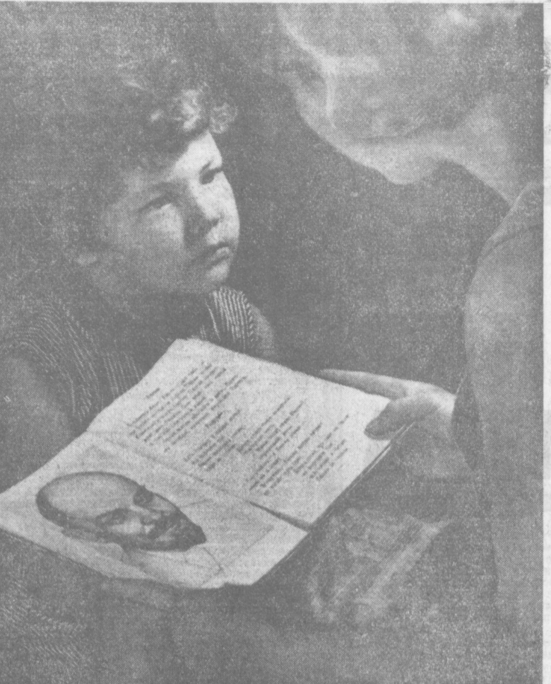
На фотоконкурс «ЛЮБОВЬ МОЯ, УЗБЕКИСТАН». Л. ГЛАУБЕРЗОН. (Ташкент). Рассказы о Ленине.