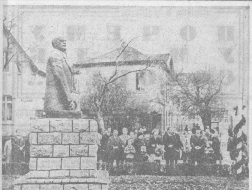
В городе Наумбурге (округ Галле, ГДР) открыт памятник В. И. Ленину.

ТОРЖЕСТВЕННО-ТРАУРНО звучит музыка. Под звуки революционных маршей идут несомняемые колонны. Проходят строители Алеска и электрики «Изабельерке Обершпрее», металлисты Кёпенина и печатники «Берднер ферлаг» — бойцы рабочих боевых групп. Плечом к плечу в одном строю шагают юноши — представители нового поколения молодой республики и ветераны рабочего движения — активные участники подпольной борьбы, пережившие две мировые войны, фашистские концлагеря. Суровы, сосредоточенны их лица. Крепко сжимают в руках оружие, четко печатают шаг. В день 50-летия со дня злодейского убийства Карла Либкнехта и Розы Люксембург они демонстрируют верность заветам вождя рабочего класса Германии, преданность идеям марксизма-ленинизма. Они полны решимости и мужества до конца бороться за свою республику — первое социалистическое государство рабочих и крестьян на немецкой земле.