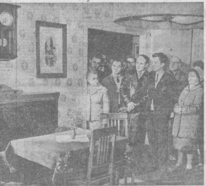
В Музее В. И. Ленина в Лейпциге (ГДР). Подругой стоит посетитель, рассматривая обстановку комнаты, в которой Владимир Ильич нелегально жил около двух недель в начале 1914 года.