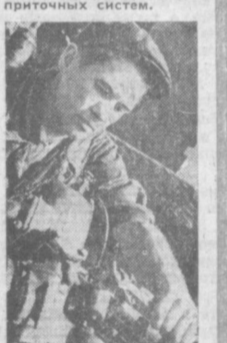
Реконструируется цех экспериментальных машин завода «Узбексельмаш». В этом цехе принимается участие одна из групп отдела отопительных, вентиляционных и промывочных аппаратов «Узгипротрактор».