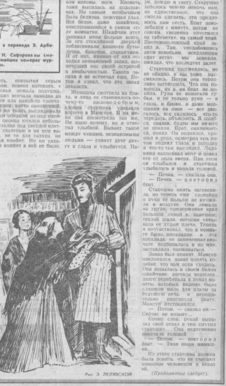
Рис 3 ЛЕЛЯВСКОЙ

— Потом, — повтори я брат. — Твоя яши мамаша... Из этого старушка должна была понять, что ее считают хорошим человеком и верят ей. (Продолжение следует).