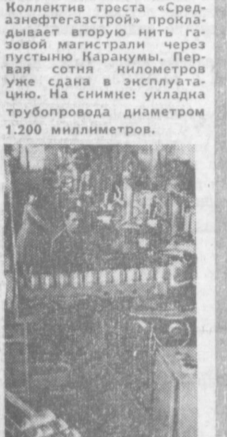
Коллектив треста «Среднегаз» прокладывает вторую нить газовой магистрали через пустыню Каракумы.