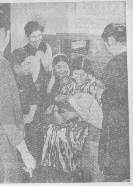
Собрались все сестры. Нет только Рано.

полные почтительною записки имен своих дочерей. Теплой волной наплывало на сердце воспоминания. Вот так, бывало, она расписывалась в школьных дневниках детей.