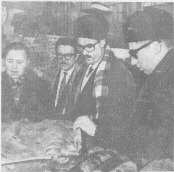
Кубинские журналисты на Ташкентском текстильном комбинате имени Сталина.

На висках коммуниста лежит седина, На груди боевые молчат ордена, А под ними, у сердца, тебе не видны — Незамысловатые, резкие шрамы войны, Но в груди у него — никогда не молчит! — Беспокойное сердце стучит и стучит, У тебя на груди не видны ордена, И погоны с твоими не известны плечом, Но, наверно, не зря прилепилась страна К пиджаку твоему комсомольский значок, Пусть же сердце твое никогда не молчит, Пусть оно беспокойно и точно стучит, Пусть тебя, мой товарищ, уводит вперед Орденов комсомола немеркнувший свет, Ты помни: седей коммунист бережет Комсомольский значок с восемнадцатилетним.