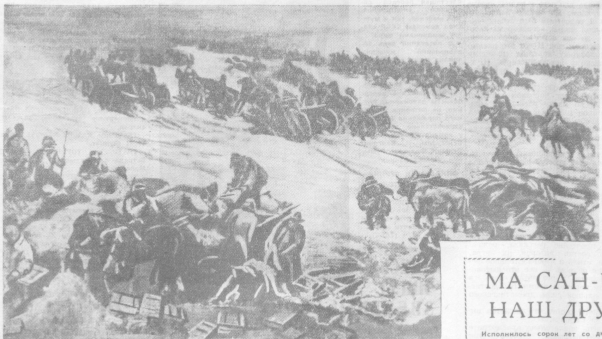
Битва за Крым, где засели войска «черного барона» Врангеля, была последним сражением гражданско-империалистской войны. Части Красной Армии империалистов и белогвардейцев, 15 ноября 1920 года взяли Крым, а в ночь на 16 ноября взяли Керчь. На рисунке художников В. Иогансона и В. Крайнева изображен переход частей Красной Армии через Сиваш для нанесения удара врангелевцам — в тыл перекопским укреплениям.