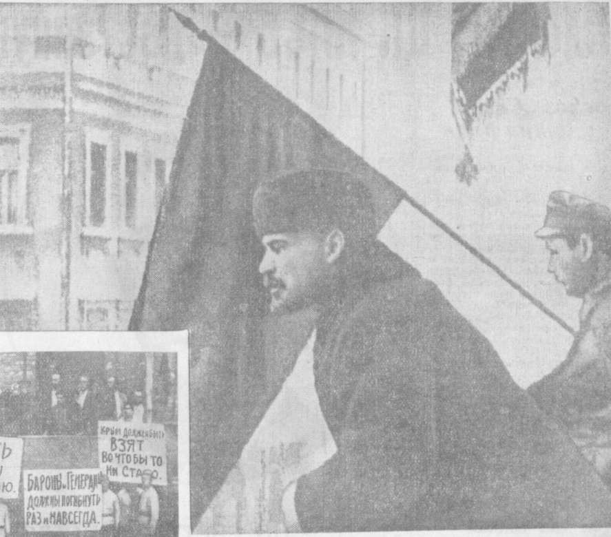
Вот они, фотодокументы тех героических дней. В. И. Ленин 16 октября 1919 года выступает с балкона Моссовета с приветствием перед рабочими-коммунистами Ярославской и Владимирской губерний, которые, как сказал В. И. Ленин, еще раз откликнулись на зов партии и дали лучшие свои силы для защиты рабоче-крестьянской республики. На снимке слева — сформированный в Полтаве коммунистический отряд перед отправкой на Южный фронт (1920 год). (Фотозаписки ТАСС).

Совет Министров СССР принял решение о повышении с 1 января 1961 года золотого содержания рубля и курса рубля к валютам иностранных государств. Золотое содержание рубля устанавливается в 0,987412 миллионных граммов чистого золота, а золотая цена Госбанка СССР на золото — 1 рубль за один грамм чистого золота. Курс рубля к доллару установлен 90 копеек за 1 доллар США. Совет Министров СССР поручил Госбанку СССР повысить курс рубля к валютам других капиталистических стран в соответствии с повышением золотого содержания рубля. В случае изменения золотого содержания валют этих стран или изменения курсов их валют Госбанку СССР поручено устанавливать курс рубля с учетом этих изменений.