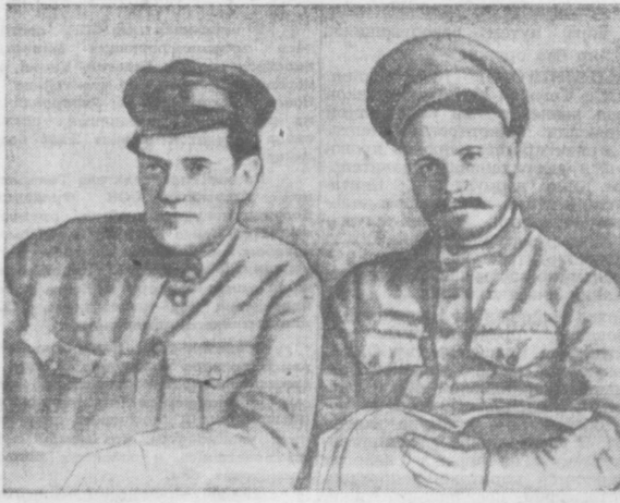
Командующий войсками Туркестанского фронта М. В. Фрунзе (справа) и член Реввоенсовета фронта В. В. Куйбышев.

Ф. КАМИЛОВ, Красногвардеец, член КПСС с 1918 года.