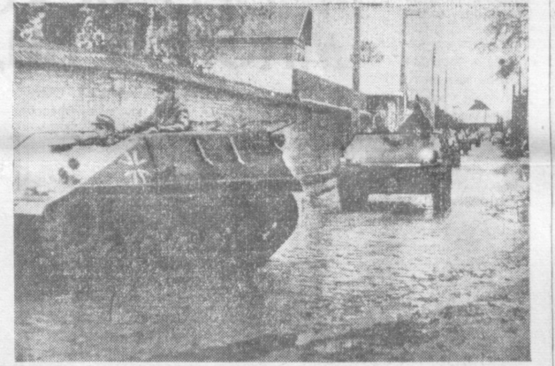
По французским дорогам движутся болгарские танки с западногерманскими солдатами. По улицам французских городов Мурелона и Сиссона разгуливают офицеры бундесвера. Они прибыли сюда с согласия французского правительства для военных учений. Французский народ возмущен случаем и наглядно тех, кто погиб за освобождение родины от фашистских захватчиков.

Все выступавшие депутаты единогласно поддержали доклад Чой Ен Гена, председателя Президиума Верховного народного собрания КНДР, и наметили конкретные пути и средства для осуществления экономического и культурного обмена между Севером и Югом, мирного объединения Кореи.