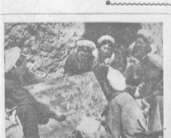
В недавнем прошлом почти все жители Тибета были неграмотны. После раскрепощения трудящиеся этого отдаленного района Китайской Народной Республики активно включились в движение за ликвидацию неграмотности, за культурную революцию. НА СНИМКЕ: группа крестьян деревни Шэнь на занятиях.

Далее газета указывала, что в связи с событиями в Лаосе у побережья Индокитала на ко-раблях находится в полном со-стае батальон морской пехоты (бо-лее тысячи человек), тотовой и интервенции».