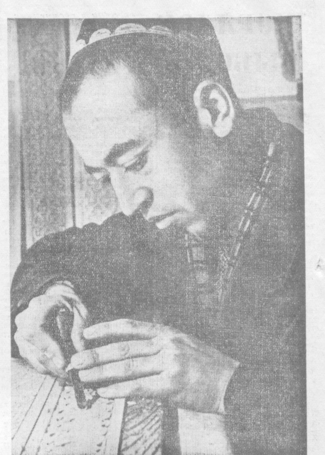
Редактор А. Д. ИВАХНЕНКО.

Ташкент В 18.00 — мультипликационный фильм «Приключения маленького нарпа», в 18.20 — выступление юного композитора по общеполитическому конкурсу (на узбекском языке), в 18.55 — концерт фортепианной музыки, в 19.00 — трансляция спектакля из театра имени Хамзы «Бай и батрак», в антрактах — последние известия.