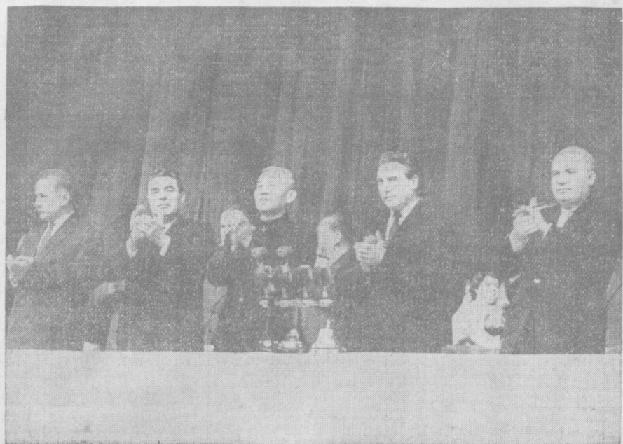
Москва, 7 декабря 1960 года. Дворец спорта центрального стадиона имени В. И. Ленина. В президиуме митинга советско-китайской дружбы.