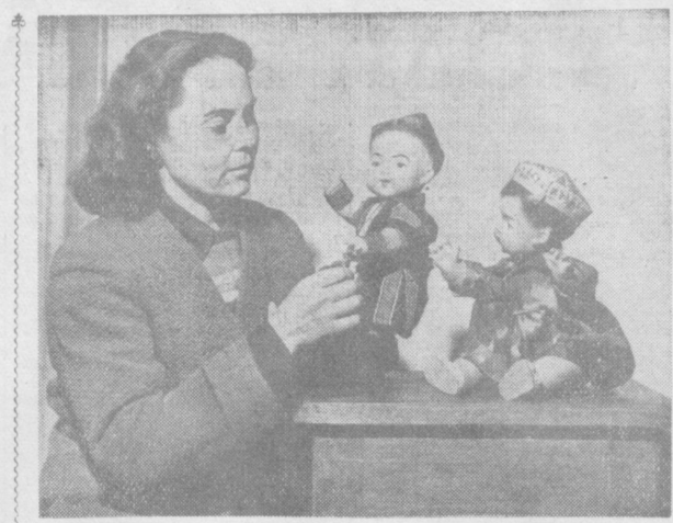
Кто не знает замечательного рассказа К. Паустовского «Ценный груз»? Напомним, в рассказе говорится об отношении советских людей к детским игрушкам, для которых они стали «ценным грузом».

«Таймс» цитирует также положения Заявления, в которых указывается на необходимость разоружения и отвергается мысль о том, что война неизбежна, а также подчеркивается необходимость социализма. Газета приводит большие выдержки из той части Заявления, где говорится об агрессивном характере американского империализма. Большое внимание Заявлению Совещания представителей коммунистических и рабочих партий продолжают уделять газеты Софии, Варшавы, Бухареста, Улан-Батора, Пхеньяна, Ханоя, Гаваны, Каира и других столиц мира. (ТАСС).