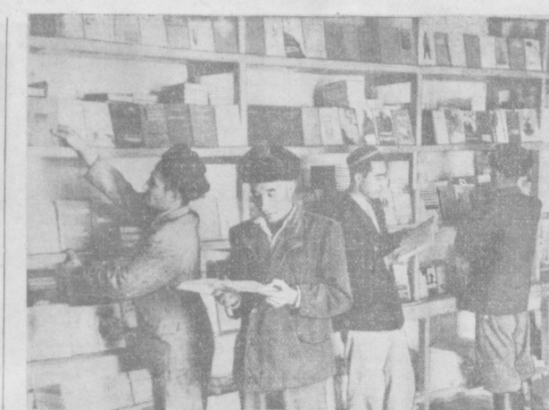
Книжная торговля в прилавке становится все более популярной в городах и сельской местности республики. Новый книжный магазин самообслуживания организован в Алате — центре Каракульского района Бухарской области. Теперь хлопкоробы и каракулеводы Алата сами подбирают необходимую литературу.