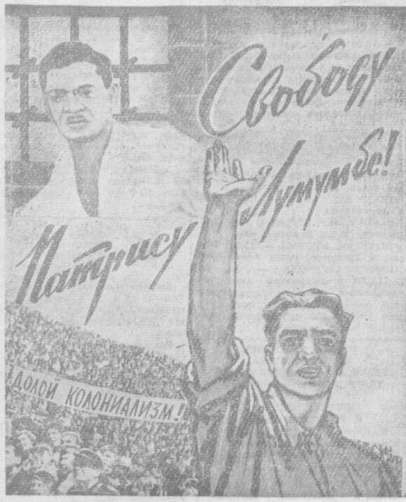
Фотомонтаж П. ШАХНАЗАРОВА.