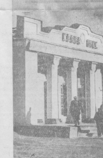
Благоустроивается поселок разведчиков недр — Гази. В этом году в пустыне построено много жилых домов, бытовых предприятий. НА СНИМКЕ: новый Дом культуры Газинской нефтегазразведки.