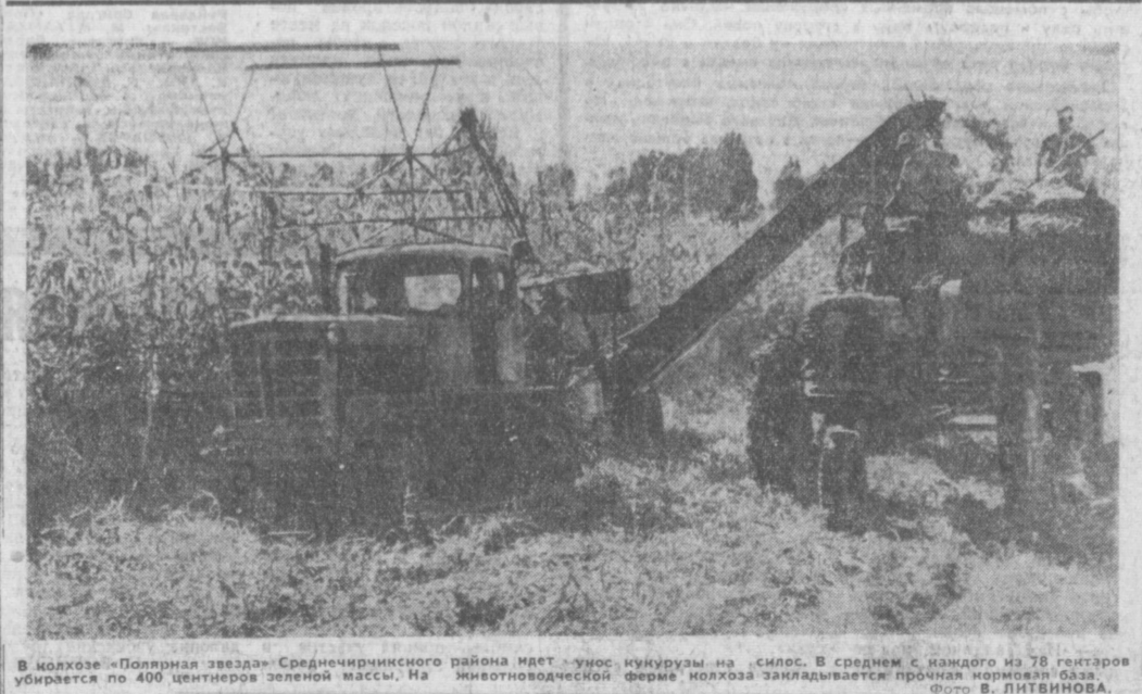
В колхозе «Поллярная звезда» Среднеиринского района идет уборка кукурузы на силос. В среднем с каждого из 78 гектаров убирается по 400 центнеров зеленой массы. На животноводческой ферме колхоза закладывается прочная кормовая база.

КАК и везде в Хорезме, хлопчатники мы в этом году посеяли позже обычного: помещали затяжные хлопья. Для ускорения роста посеяли семена 3—4 градуса. В последние дни августа температура поднимается резко. И подопытная хлопчатника, мы восполняем собственными силами. Он предусматривает, что в среднем по колхозу все плантации получат еще полторы обработки. До 10 августа завершим чеканку. Уход за плантациями будет строго дифференцированным. Например, там, где хлопчатник рослый и имеет тенденцию к дальнейшему росту, мы внесем на гектар по 10—12 тонн дувальной земли. Этой дувальной земли — замечательное средство — помогающее предотвратить и прекратить жиривание кустов и направить все силы на плодотворение. Полив по средине по силе кустов, в первую половину августа мы будем давать местные органические удобрения. Это тоже проверенный дехканский прием, он тоже дает солидную прибавку урожая. Мы надеемся окончательно дивиндровать последнюю погоду и вырастить такой урожай, который позволит нам с честью выполнить обязательство, взятое в честь 100-летия со дня рождения В. И. Ленина.