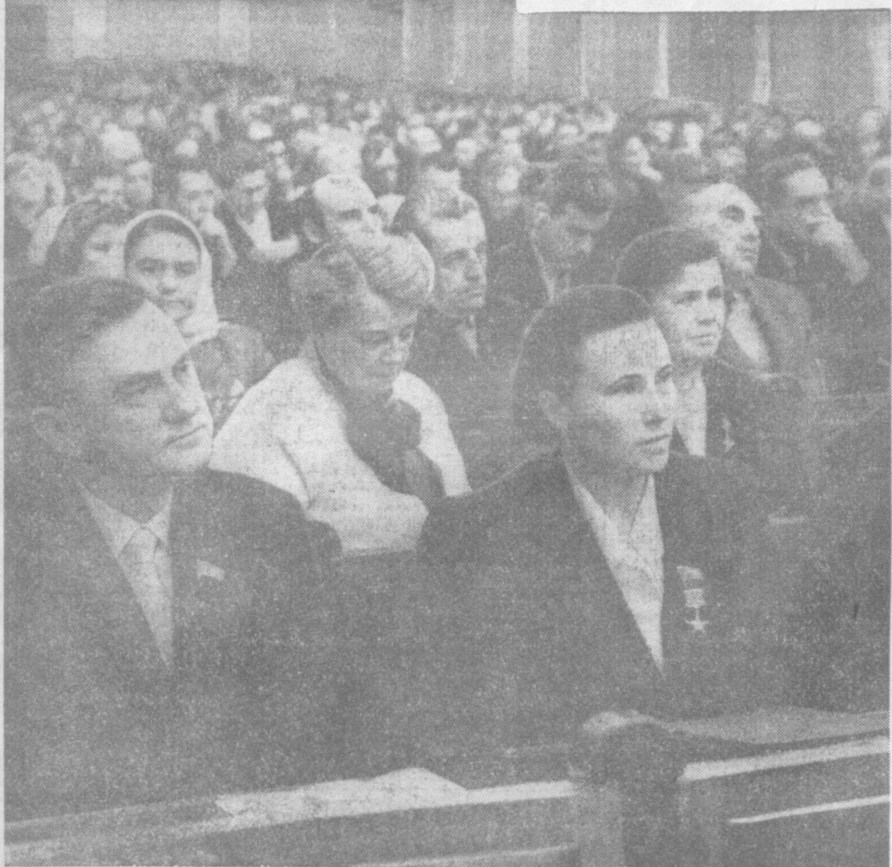
В зале заседаний Верховного Совета СССР.