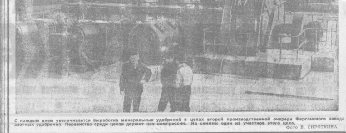
С каждым днем увеличивается выработка минеральных удобрений в цехах второй производственной очереди Ферганского завода азотных удобрений. Переностро средот цехов держит цех компрессии. На снимке: один из участков этого цеха.

«В радужном начале годовым себодобные аксакалы, узнав о решении девушек хозяйничать на землях Маданиятского массива. Оно-то верно, не видела пока эта земля настоящего хозяина. Каждой бригаде по кусочку разобрали, и у всех словно по лямке рту прибавилось. Один хозяин нужен, но не девчонки же!»