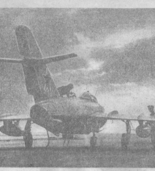
Идет дозаправка самолета к повторному вылету.

И. ТИТОВ. Второй секретарь Самаркандского обкома Компартии Узбекистана.