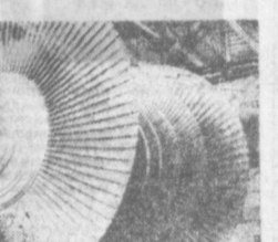
БЕЛОРУССКАЯ ССР. На Лукомльском ГРЭС коллектив участка треста «Центрэнергокомонтаж» приступил к монтажу первого турбогенератора мощностью 300 тысяч киловатт. На снимке: подготовка работ к установке.