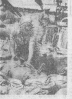
МОЛДАВСКАЯ ССР. Успешно идет жатва озимых в совхозе имени 50-летия Октября. На первом плане — работники совхоза Пасковия Община.