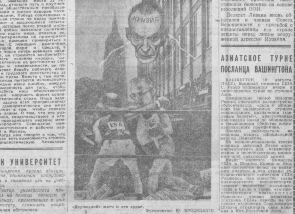
«Дружеский» матч и его судья.

Проболкая «валютную войну», западные партнеры еще более углубляют общий кризис империализма.