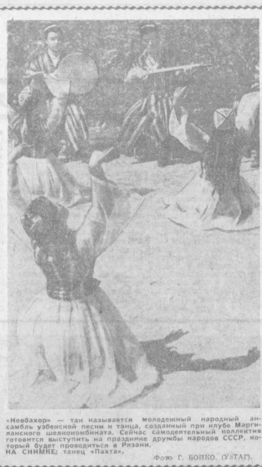
«Новбажор» — так называется молоденький народный ансамбль узбекской песни и танца, созданный при клубе Маргиланского шелководничества.