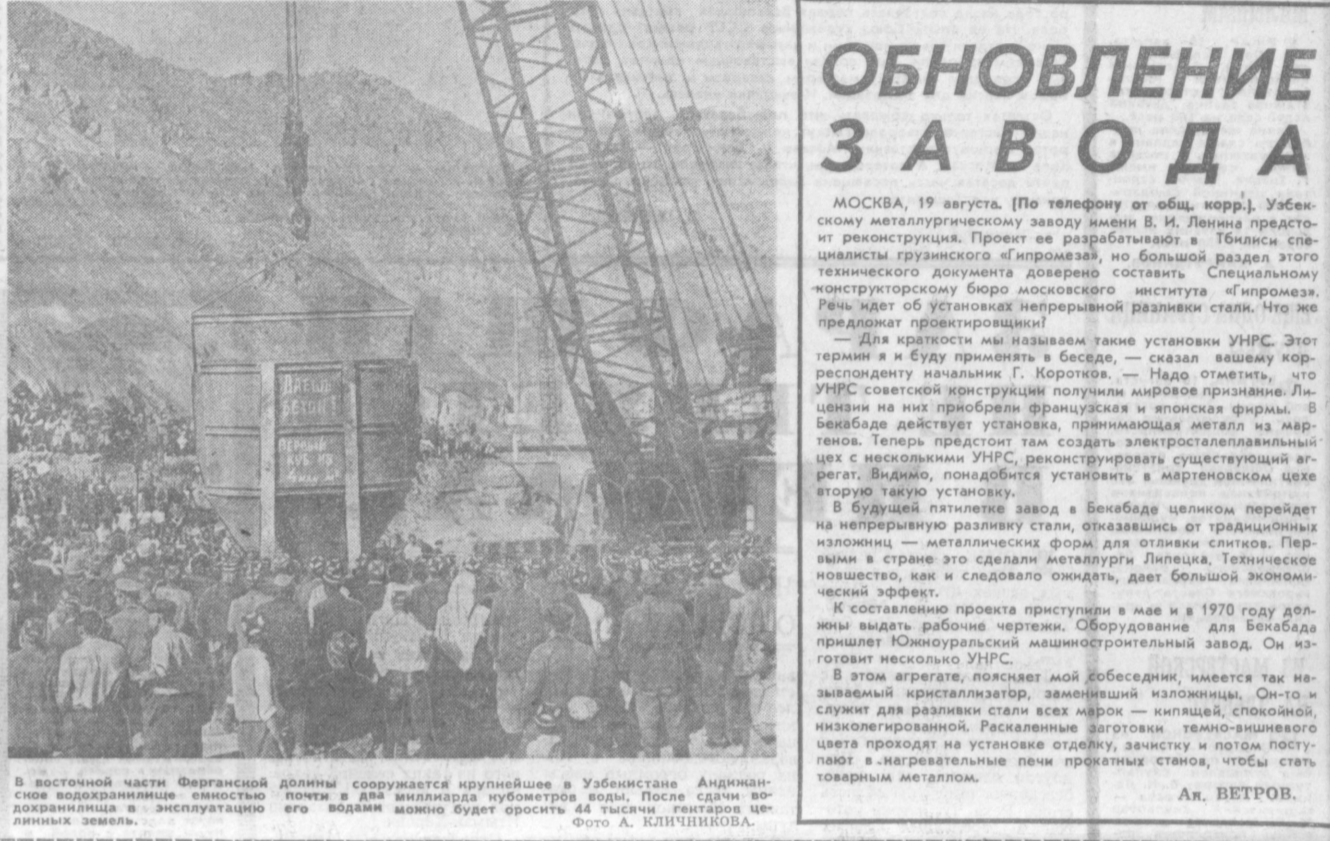
В восточной части Ферганской долины сооружается крупнейшее в Узбекистане Андиканское водохранилище емкостью почти в два миллиарда кубометров воды. После сдачи водохранилища в эксплуатацию его водами можно будет оросить 44 тысячи гектаров ценных земель.