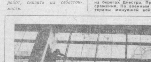
ВОЛОГОДСКАЯ ОБЛАСТЬ. Полным ходом идет монтаж технологического оборудования на строительстве Череповецкого азотно-тукового завода.