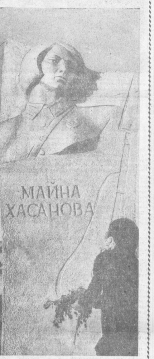
Подобие героя увековечивает строка поэта, кисть художника, резец скульптора... И подобие живет не только в памяти народной. Он живет как прекрасное произведение искусства. Это памятник славы дочери узбекского народа Майне Хасановой, недавно воздвигнутой в селении Гузар. Автор — ташкентский скульптор В. Оганесян.