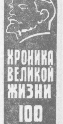
ХРОНИКА ВЕЛИКОЙ ЖИЗНИ 100

1906 — Владимир Ильич ЛЕНИН пишет статьи «Перед бурей» (передовая), «О бойкоте», «Политический кризис и провал оппортунистической тактики», «К событиям дня» и заметку «О рабочем съезде, которые опубликованы в № 1 газеты «Пролетарий».