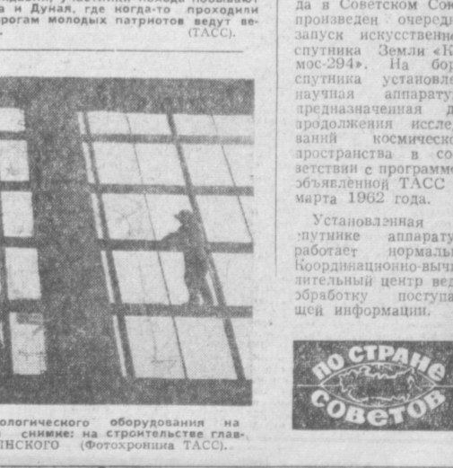
ВОЛОГОДСКАЯ ОБЛАСТЬ. Полным ходом идет монтаж технологического оборудования на строительстве Череповецкого азотно-тукового завода.