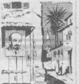
Рис. Д. Синицкого.