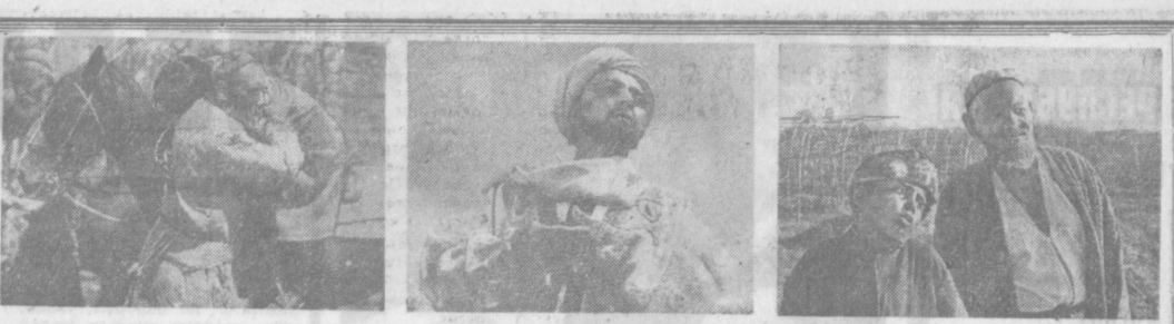
«Клятва», «Алишер Навои», «Ташкент — город хлебный».

В. ВОРОНИНА. Спец. корр. «Правды Востока», г. Андижан.