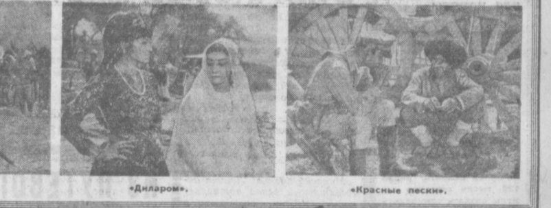
«Всадники революции», «Диларом», «Красные пески».