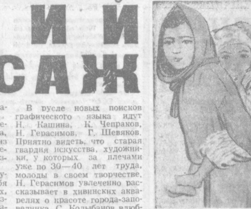
Г. ШЕВЯКОВ. «Насиба и Усар».

Набрал в итоге двухдневной борьбы 104 очка, мужская команда Ташкента выиграла соревнования 1/2 кубка и теперь продолжит борьбу в четвертьфинале, который состоится в Челябинске. Мужская команда Ленинграда, отстав на 8 очков, вышла